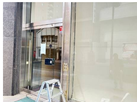
入口看板硝子文字撤去