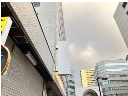
一番町ロビー袖看板文字消し